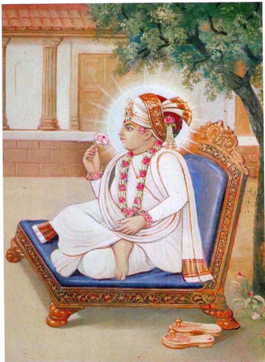
सर्वोपरी उपास्य मूर्ति पूरुष पुरुषोत्तम श्री स्वामिनारायण भगवान